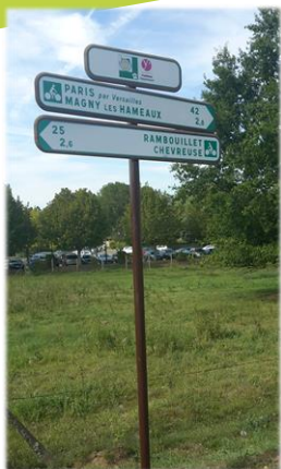
Jalonement de la Véloscénie