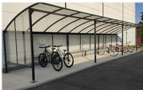
Stationnement vélo à la piscine du Mesnil-Saint-Denis