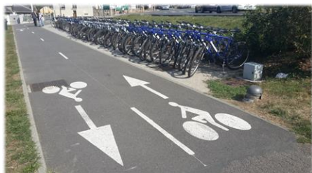
Itinéraire de la Véloscénie