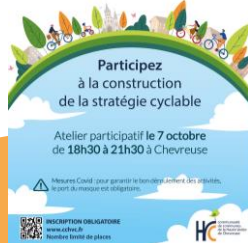
Schéma directeur de la communauté de communes de la Haute-Vallée de Chevreuse